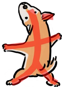
たっている「犬」のようす