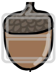
なかみが白い どんぐりを あらわす