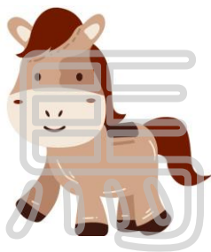
馬のすがたをあらわす