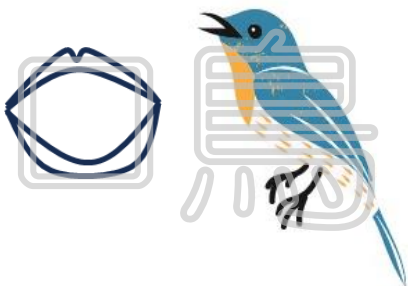
とりが口をつかって 鳴いているようす