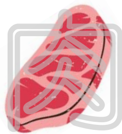
すじの はいった肉を あらわす