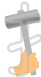
手をあらわす 「てへん」